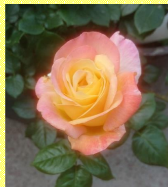
橋口家に咲くバラ(名:ピース)

6月2日の横浜開港祭の花火、皆さんのお家から見えましたか？会場に人が集まらないようにと各区で1分間だけ打ち上げた花火、残念ながら私の自宅では音しか聞こえなかったのですが、花火の音を聞きながら新型コロナの影響でたくさんのイベントが中止になったりと、この1年半近くいろんなことを我慢してきたなあと考えていました。6月13日時点で1758万人の方がワクチンの接種を受けたようです。もう少しだけ我慢して、来年はみんなで開港祭をお祝いできるといいなと思っています。